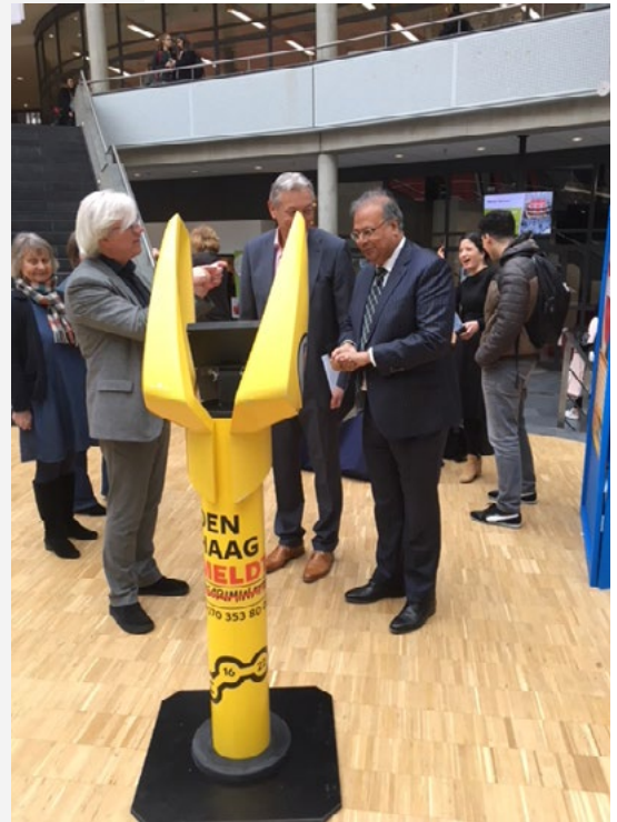
Opening Pratpaal project bij Haagse Hogeschool.