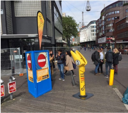
Pratpaal project op de Grote Markt in Den Haag